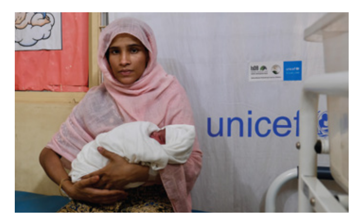
UNICEF-supported primary health centres deliver top-tier maternal and newborn healthcare services in the Rohingya refugee camps of Cox's Bazar.

• In Jordan, US$2.9 million from Al Ghurair Refugee Education Fund contributed to GMPFC was used to support vulnerable Syrian refugee children and young people (24-12 years old) to improve learning, development and well-beina. Through the programme, Makani ('My Space' in Arabic) centres provided a safe space for children and young people to access learning opportunities, child protection and other critical services. In 2021, with the support of the GMPFC and other UNICEF continued donors. its effective implementation of the Makani approach, reaching about 83.000 vulnerable individuals. including over 90,000 adolescent and youth (62 per cent female), with an integrated package of services. Of this total, 21 per cent live in refugee camps, 75 per cent live in host communities, and 3 per cent in informal tented settlements.