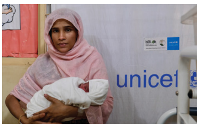
UNICEF-supported primary health centres deliver top-tier maternal and newborn healthcare services in the Rohingya refugee camps of Cox's Bazar.

ه. قوة الحضور: منصة عالمية لتقدير وإبراز مساهمات الصندوق وشراكاته، بدعم من مجلس الإدارة المرموق.