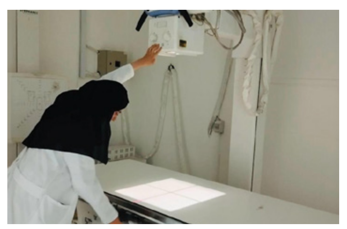
Medical Intern within IsDB STEP training and education programme, Irbid, Jordan.

للحوكمة والمساءلة. يقبل الصندوق التبرعات العامة والصدقات، ويقدم قنوات موثوقة لبرامج الزكاة، مما يساعد في مكافحة الفقر وتحسين حياة الفئات المستضعفة. يخدم الصندوق مجموعة متنوعة من الجهات، بما في ذلك الهيئات الخاصة، وهيئات الزكاة، والشركات، والمؤسسات، والأفراد، بهدف تحقيق تأثير استراتيجي كبير على الأطفال والشباب.