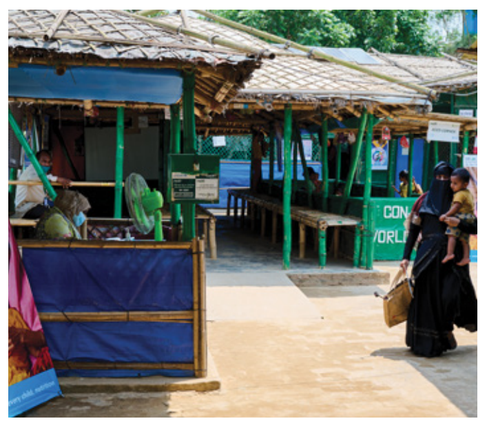
Integrated nutrition facilities in Cox's Bazar refugee camps provide critical nutrition support to Rohingya mothers and children.