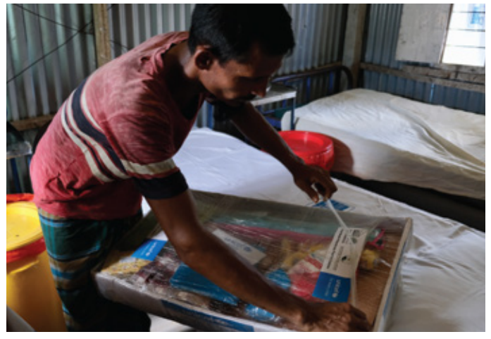
A Rohingya father unwraps a 'Momma-Baby Kit' provided by the primary health centre.

workers. 200,000 children were immunized with the pentavalent vaccine first dose, representing %106 of the targeted goal. Overall, the programme significantly bolstered essential health services for more than 1.13 million children under five years of age, achieving %116 of the intended target.