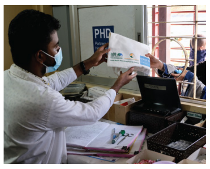
Primary health centres in Cox's Bazar refugee camps ensure Rohingya families receive essential medicines.