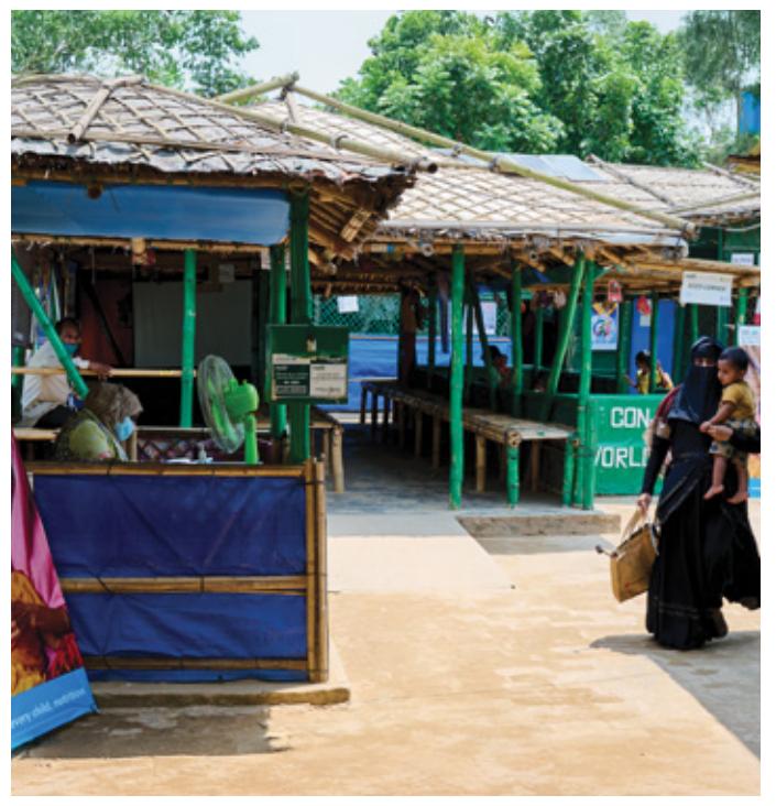
Integrated nutrition facilities in Cox's Bazar refugee camps provide critical nutrition support to Rohingya mothers and children.

The GMPFC Governing Council quickly approved deployment of funding to selected programmes managed by UNICEF and IsDB in Pakistan, Jordan, Lebanon and Bangladesh.