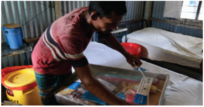
A Rohingya father unwraps a 'Momma-Baby Kit' provided by the primary health centre.