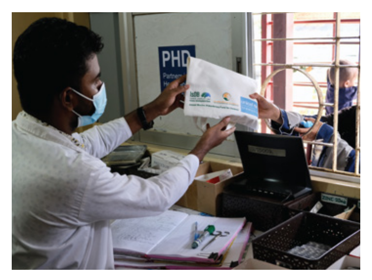
Primary health centres in Cox's Bazar refugee camps ensure Rohingya families receive essential medicines.

High Visibility: The partners work collectively to offer a global platform of recognition and visibility for contributions and partnerships, including through the GMPFC Governing Council.