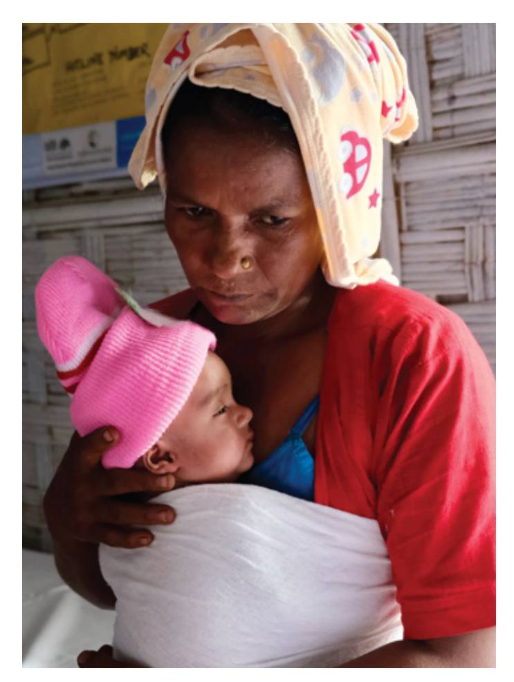
Rohingya mothers and newborns receive comprehensive maternal and neonatal care at UNICEF-supported health centres in Cox's Bazar refugee camps.

Building on firmly established partnerships and track record, UNICEF and IsDB invite prominent Muslim philanthropists and institutions to join in support of IsDB and its partners to strengthen a global community of Muslim and other institutional donors in addressing the needs of children and young people, especially children affected by global and regional crises.