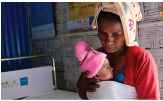
Rohingya mothers and newborns receive comprehensive maternal and neonatal care at UNICEF-supported health centres in Cox's Bazar refugee camps.

واستناداً إلى الشراكات الوطيدة والخبرة الواسعة. تدعو اليونيسف والبنك أبرز المحسنين والمؤسسات الخيرية الإسلامية إلى الانضمام إلى تحالفنا في سبيل مساعدة البنك وشركائه على تعزيز مجتمع عالمي من المؤسسات المانحة الإسلامية وغير الإسلامية من أجل تلبية احتياجات الأطفال والشباب، ولا سيما الأطفال المتضررين من الأزمات العالمية والإقليمية.