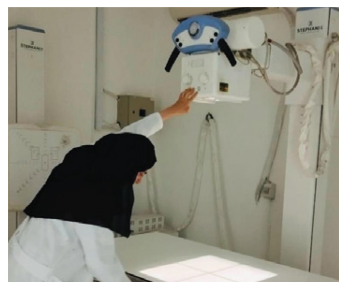
Medical Intern within IsDB STEP training and education programme, Irbid, Jordan.

channel for Zakat eligible programmes to help lift people out of poverty. The fund can serve private foundations, Zakat agencies, corporations, institutions and individuals, in delivering the greatest strategic impact for children and young people.