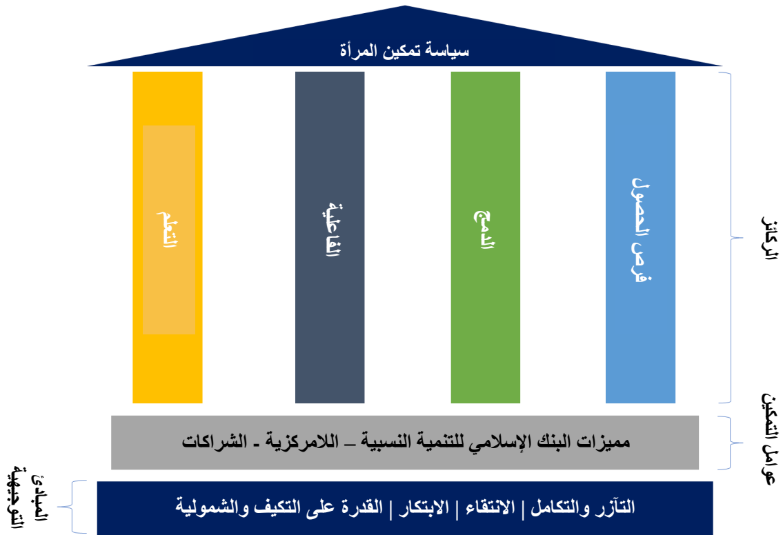
الشكل ٣ - إطار سياسة تمكين المرأة

يتكون إطار السياسة كما هو مفصل في الشكل أدناه من أربع ركائز، مما يعكس تحديات وأولويات البلدان الأعضاء، بالإضافة إلى التزامات البنك الإسلامي للتنمية على المستوى المؤسسي والعالمي لدعم البلدان في تحقيق التزاماتها الوطنية والدولية. وتشمل الركائز: فرص الحصول، والدمج، والفاعلية والتعلم. وسوف يقوم البنك الإسلامي للتنمية بالتعامل مع هذه الركائز من خلال الاستعانة بالمبادئ التالية: الاستفادة من التآزر وأوجه التكامل، واتخاذ القرارات الاستراتيجية في مجالات وأساليب المشاركة، وتشجيع الابتكار، والقدرة على التكيف لضمان شمولية الجميع. وبالإضافة إلى ذلك، سيتم تحفيز تلك الركائز والمبادئ بواسطة العوامل المساعدة الرئيسية التي تستغل الميزة التنافسية التي يتمتع بها البنك الإسلامي للتنمية وأدواته الفريدة، والاستفادة من هيكله اللامركزي وتعزيز الشراكات.